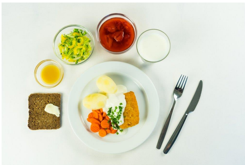
Kuva 1. Lautasmalli auttaa kokoamaan monipuolisen aterian. (5)

Lautasmalli on hyvä apu monipuolisten aterioiden koostamisessa (Kuva 1). Täytä kolmasosa annoksesta tuoreilla tai kypsennetyillä kasviksilla, kolmasosa kalalla, lihalla, palkokasveilla tai muulla proteiinipitoisella ruualla ja kolmasosa perunalla, makaronilla tai riisillä.