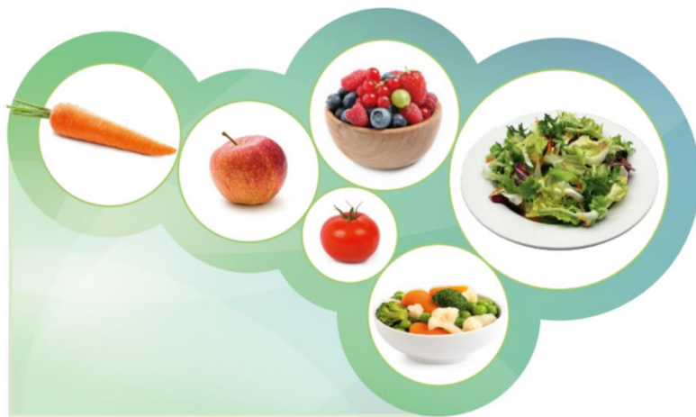
Kuva 3. Esimerkki päivittäisistä kasvisannoksista. (5)

Voit kypsentää kasviksia pehmeämmiksi, raastaa niitä hienoksi raasteeksi tai nauttia ne runsaan salaatin-kastikkeen kera. Täysmehut, kiisselit, soseet ja rahkat ovat hyviä vaihtoehtoja tuoreille hedelmille ja marjoille.